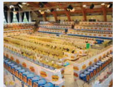
Seit Jahren ist HAVENS Partner der LV-Schau Westfalen-Lippe.